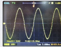
Dạng sóng Sine