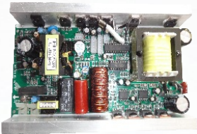
AR6D PCB mode