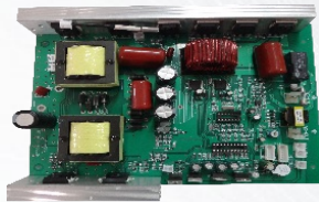
AR10D PCB mode